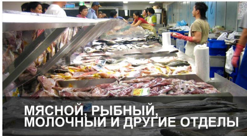
МЯСНОЙ, РЫБНЫЙ, МОЛОЧНЫЙ И ДРУГИЕ ОТДЕЛЫ