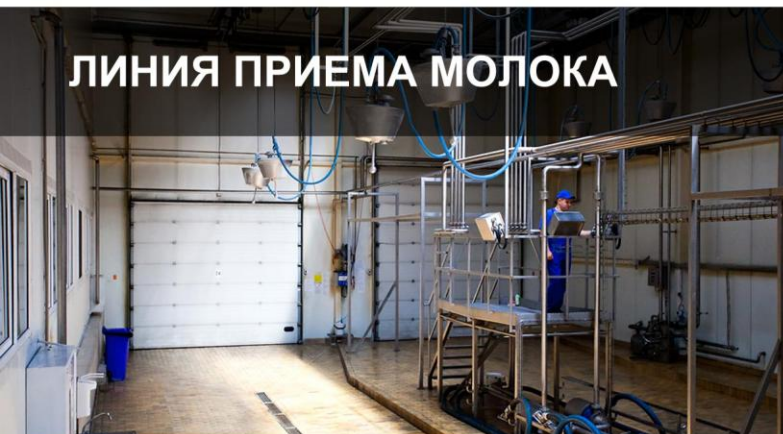
ЛИНИЯ ПРИЕМА МОЛОКА